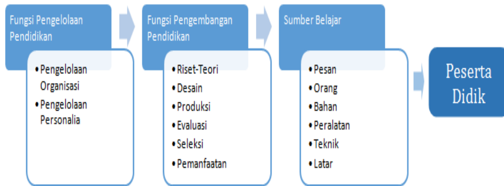
Gambar 1. Bagan Kawasan Teknologi Pendidikan (Soeharto, Karti : 1996)

yang dapat dilakukan untuk meminimalisirkan permasalahan-permasalahan tersebut adalah dengan melakukan pengembangan media pembelajaran. Berdasarkan gambar di bawah menunjukkan bahwa komponen bahan (media) merupakan salah satu jenis sumber belajar yang berfungsi menyelesaikan permasalahan dalam suatu proses pembelajaran. Keefektifan media pembelajaran memegang andil besar dalam keefektifan pengajaran. Semakin baik kualitas media pembelajaran, maka semakin efektif pengajaran dan secara tidak langsung tujuan pembelajaran akan lebih mudah dan cepat tercapai.